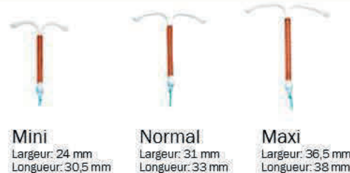
Mini Largeur: 24 mm Longueur: 30,5 mm

Sethygyn 380 Ag Maxi - Code ACL 7 : 9712133 - Code ACL 13 : 3401097121338