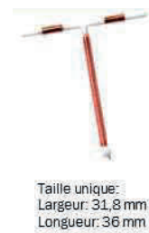
Taille unique: Largeur: 31,8 mm Longueur: 36 mm