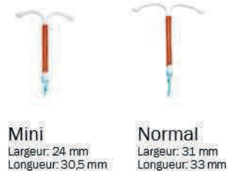
Mini Largeur: 24 mm Longueur: 30,5 mm

Sethygyn 380 Cu Normal - Code ACL 7 : 9712179 - Code ACL 13 : 3401097121796